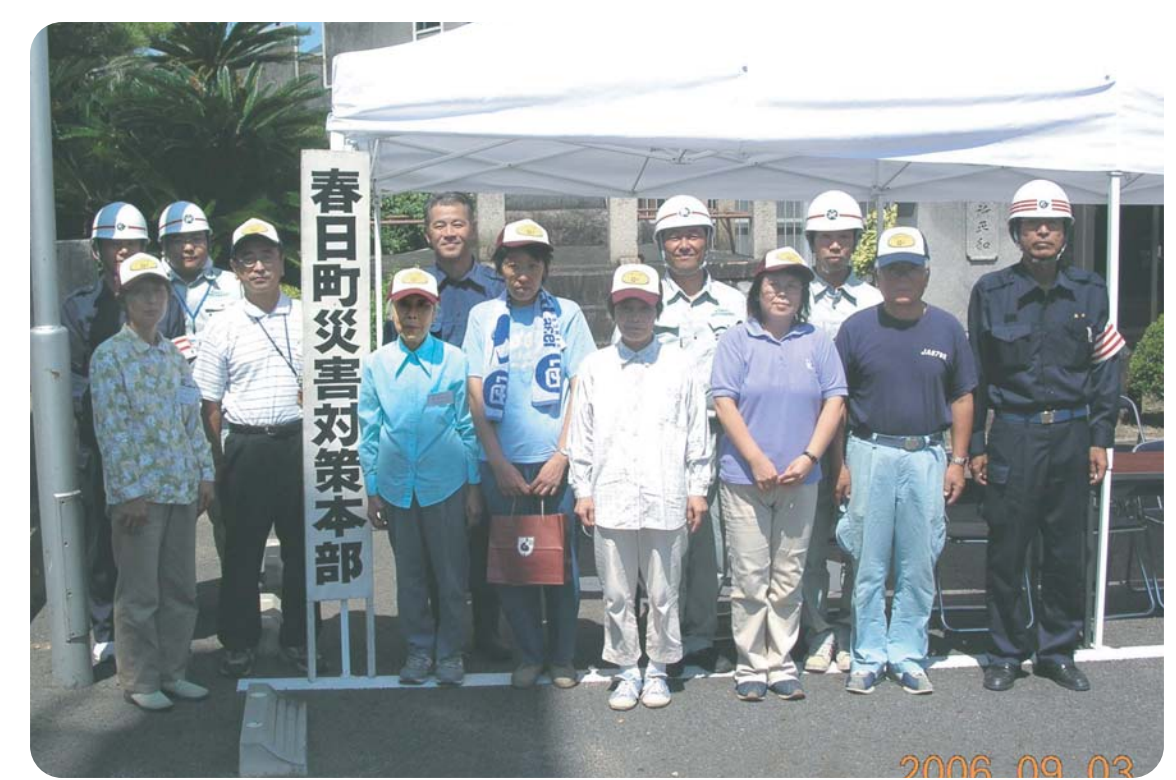
平成18年度 春日町防災訓練に参加