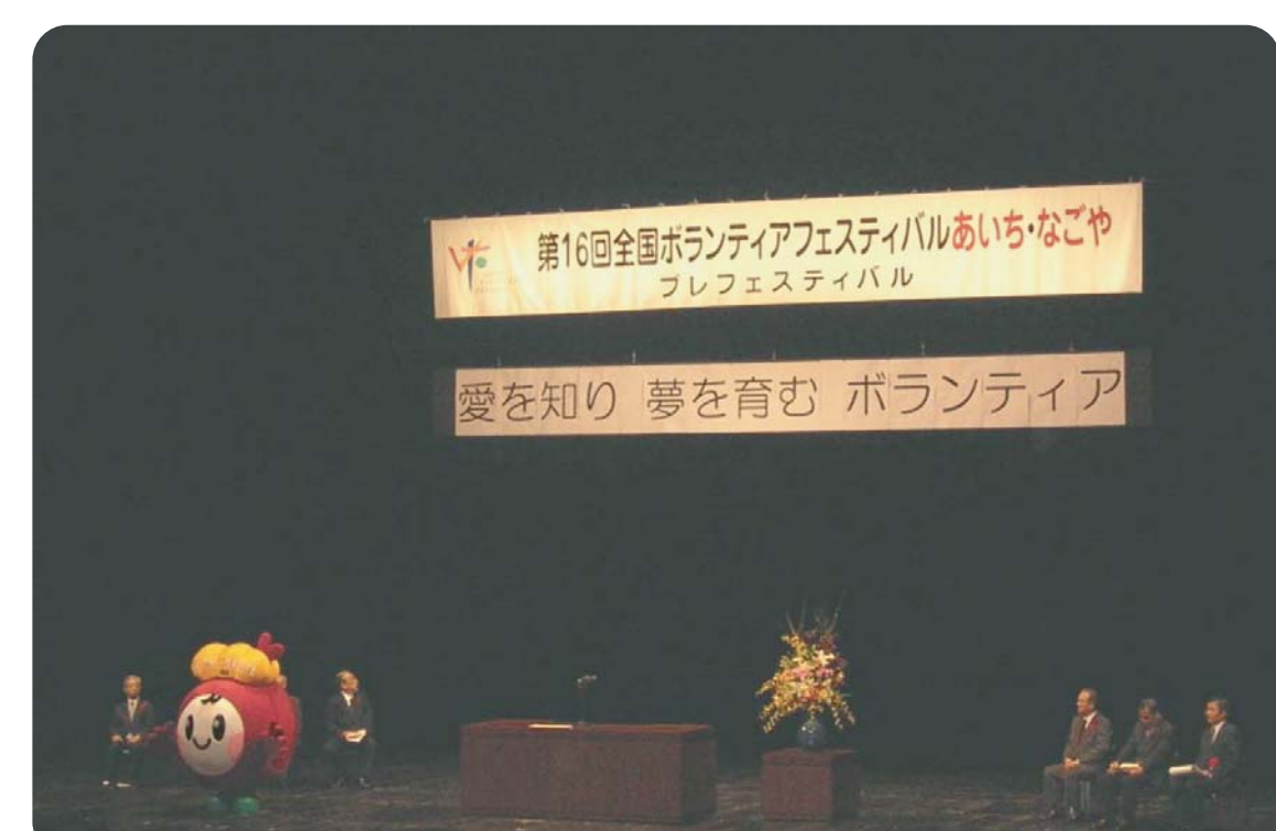
平成18年10月9日 於 愛知芸術文化センター 全国ボランティアフェスティバルが 来年度、愛知県で開催されます。