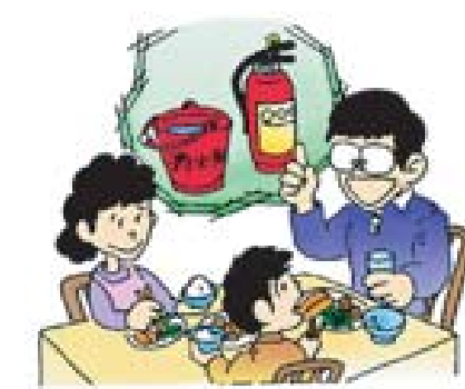
第22回防災ポスターコンクール