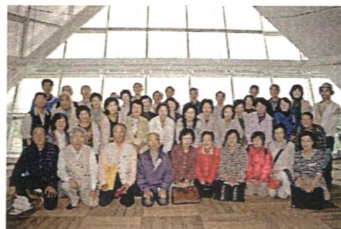
見学会参加者集合写真