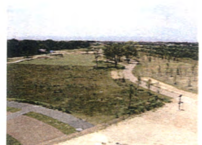
晴れた日は138タワーから伊吹山まできれいに見渡せます。