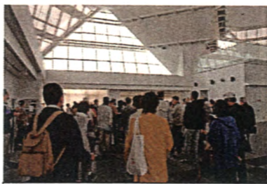
クリスタルフラワー

前日と翌日は快晴でしたが、何故か当日は大雨でした。公園周辺には、特定外来種ではありませんがオオキンケイギクの黄色の花、河川敷にはセンダンの紫色の花、ノイバラと思われるバラ科の白色の花が雨に濡れて、一段ときれいに咲いていました。